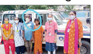
પિતા-પુત્રી સાથે અભયમની ટીમ.

તાવનગર, તા. ૧૨ : ભાવનગરનાં એસ.ટી. ડેપોએ એક ૧૨ વર્ષની દિકરી બેસી હોવાનો ૧૨ અભયમને ક્ષેત્ર આવતાં ટીમમાં કાર્ડબોર્ડ હોવાના રીડ, કાર્ડબોર્ડ પુરવામાં અને પાયાલટ જવાદીયાઈ ચોણાદ દ્વારા જસ રોડ પાછા વળે જતા દિકરીનું કાઉન્સિલીંગ કરવામાં આવેલ પુરુષરક્ષાના આ દિકરી મહુવાથી ભાવનગર અભયમ ટીમી ઉતરી ગઈ હતી. મુજ દાહો વતન ધરાવતી બાળકી પિતા સાથે મહુવા-બોટાદ રોડથી પાસે ગણે પાછાવવામાં પોલીસ માટે આવેલા હતા. જે બાદ મહુવા પોલીસનો સંપર્ક કરી બાળકીને તેની પિતા સાથે મિલન કરાવ્યું હતું.