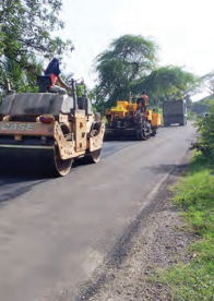
તાલાળા- વેરાવળ માર્ગમાં પ્રજના ખર્ચે ગાળડાં બુરવાનું કામ. (સહકારીય યોજના)

તાલાળા: તાલાળાથી વેરાવળ સુધી ૨૮ કિ.મી.નો હેંવાત માર્ગ દસ મીટર પહોળા કરવા રૂ. ૨૦ કરોડ, ૫૫ લાખનું કામ પાંચ વર્ષ પહેલાં કોન્ટ્રાક્ટરને આપવામાં આવ્યું. પણ આ માર્ગ નવા બનાવવાના બદલે માર્ગ અને મકાન વિભાગ દ્વારા અને તે પણ સ્વયંને મરામતની કમગીરી હાથ ધરતા કોન્ટ્રાક્ટરને જલવાર બાંધકામ વિભાગના બાબુઓ સામે રોમ પ્રસ્તે છે.